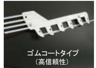
ゴムコートタイプ (高信頼性)