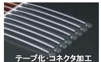
テープ化・コネクタ加工