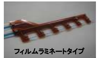
フィルムラミネートタイプ